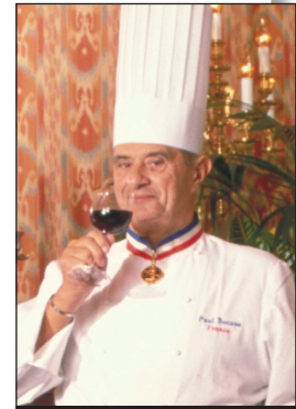
RA Tourisme's Marciel

Le lieu incontournable : les rives de la Saône, 5.700 m de berges situées sur le territoire communal, pour la